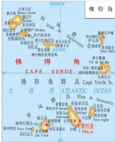
图 1 佛得角地图

佛得角位于北大西洋中部，地扼美、非、欧 3 洲海上交通要冲，与塞内加尔、毛里塔尼亚隔海相望。目前仍是各洲远洋船只及大型飞机过往的补给站，被称为“连接各大洲的十字路口”。全国由 10 个岛屿组成，国土面积 4033 平方公里，海岸线长 965 公里。佛得角拥有专属经济区 73.43 万平方公里。