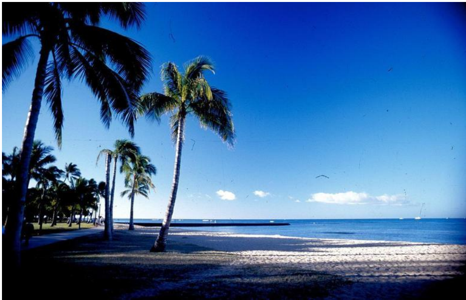
图 3 佛得角风景

佛得角经济以服务业为主，服务业产值占国内生产总值 (GDP) 的四分之三，粮食不能自给，工业基础薄弱。佛得角 GDP 构成为：第一产业 4.63%，第二产业 19.61%，第三产业 75.76%。